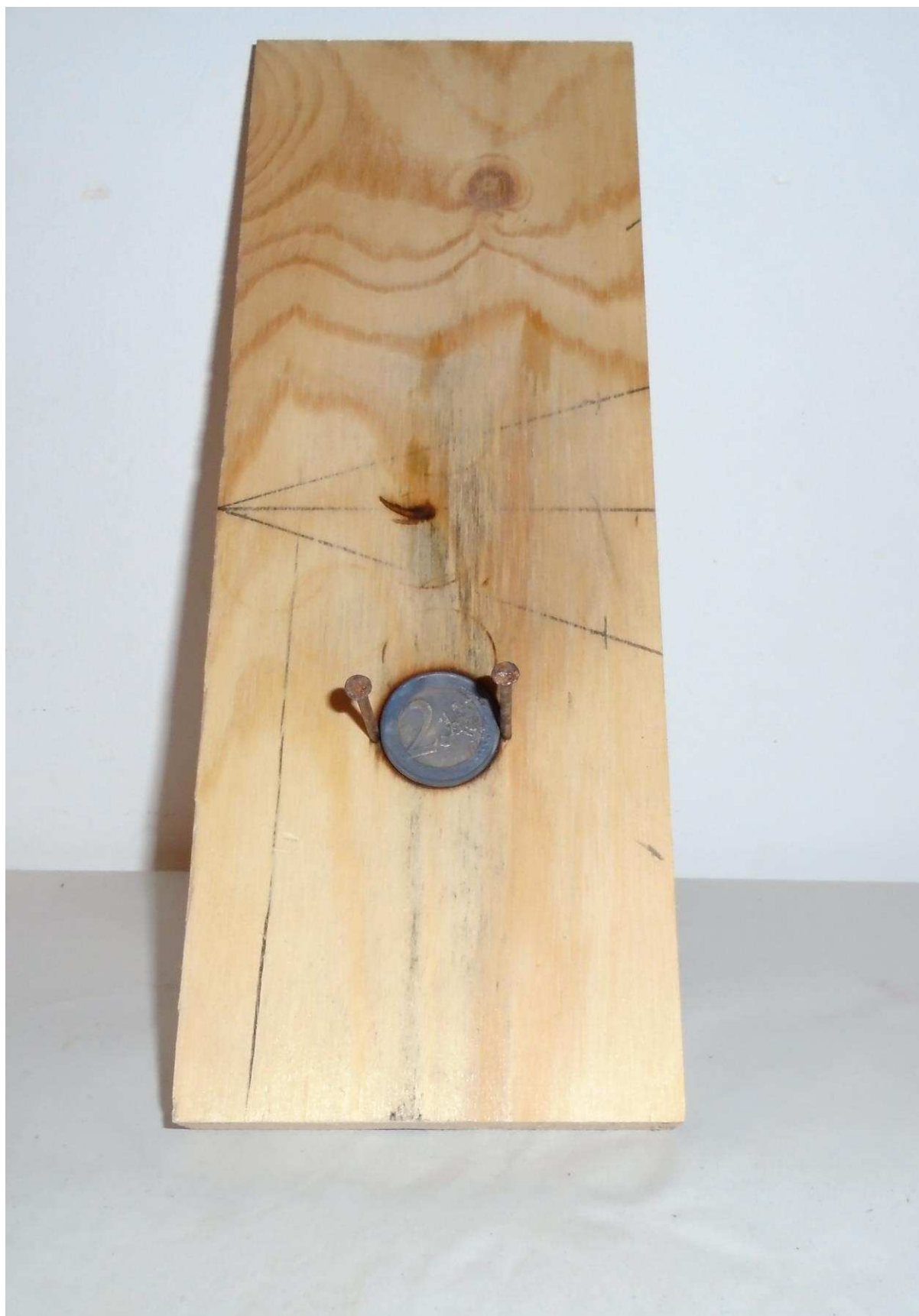
Συγγραφή: Στυλιανακάκης Γιάννης – Δάσκαλος / Συνεργάτης του ΕΚΦΕ Χανίων για την Π.Ε. Φωτογράφιση – Ηλεκτρονική επεξεργασία: Γιαννενάκης Κων/νος - Δάσκαλος