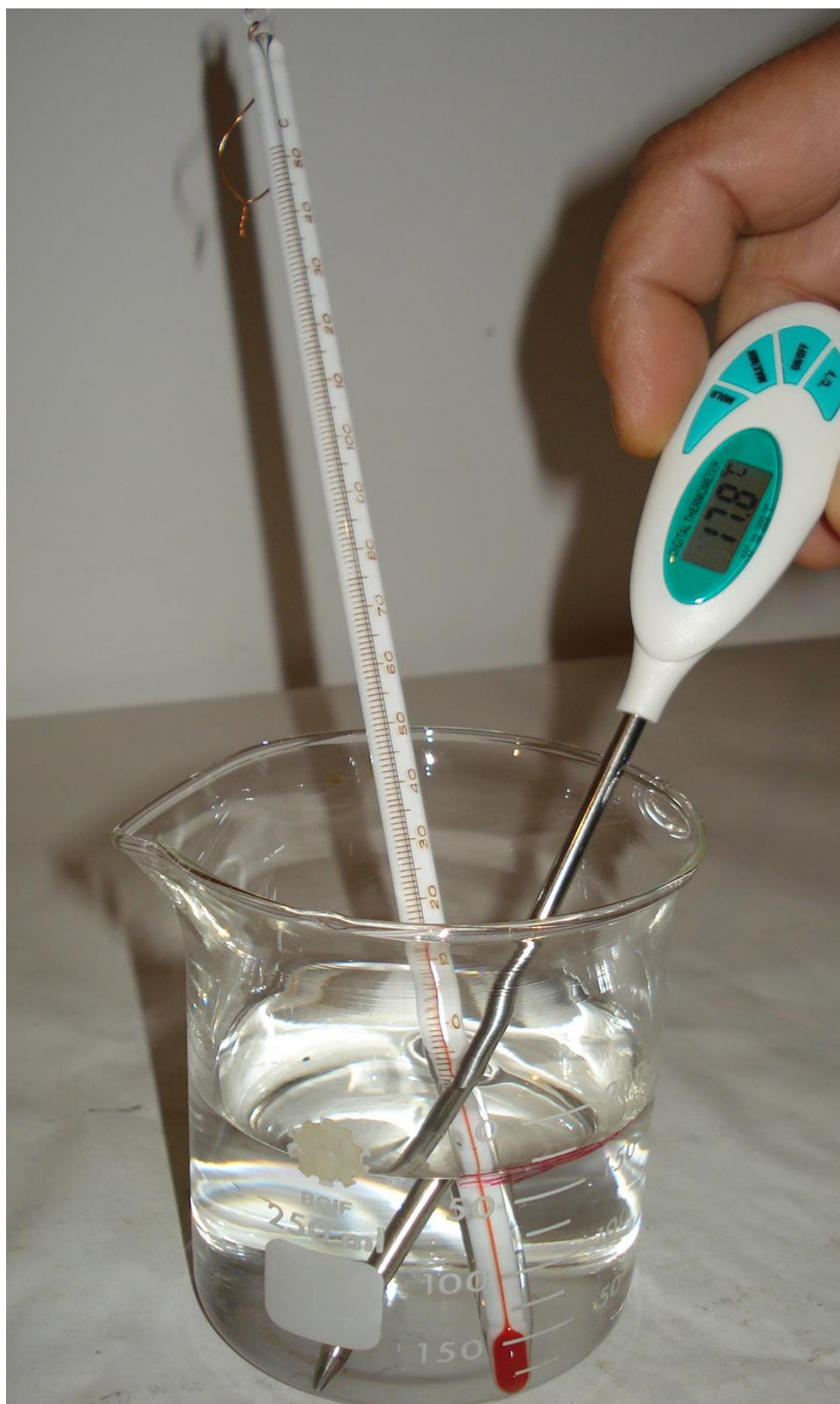
Συγγραφή: Στυλιανακάκης Γιάννης – Δάσκαλος / Συνεργάτης του ΕΚΦΕ Χανίων για την Π.Ε. Φωτογράφιση – Ηλεκτρονική επεξεργασία: Γιαννενάκης Κων/νος - Δάσκαλος