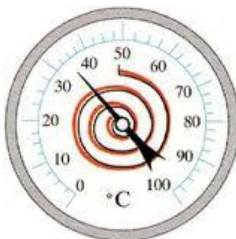
θερμόμετρο με διμεταλλικό έλασμα