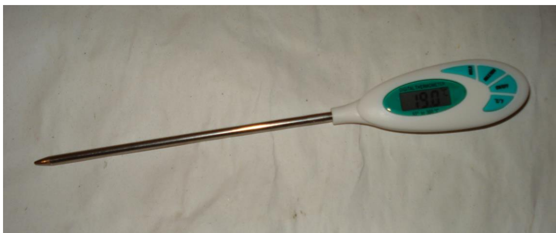
ψηφιακό θερμόμετρο εργαστηρίου