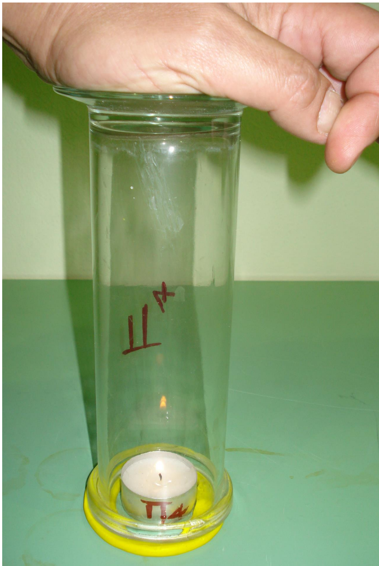
Συγγραφή: Στυλιανακάκης Γιάννης – Δάσκαλος / Συνεργάτης του ΕΚΦΕ Χανίων για την Π.Ε.