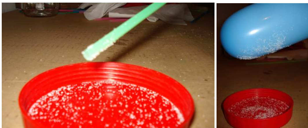
Καλαμάκι ή μπαλόνι ζαχαρωτό ή αλμυρό