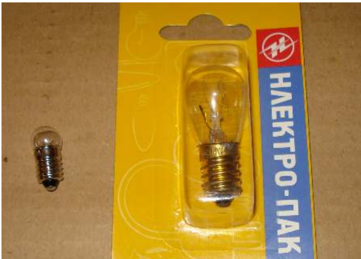
Λαμπτήρες, λαμπάκια – βιδωτοί