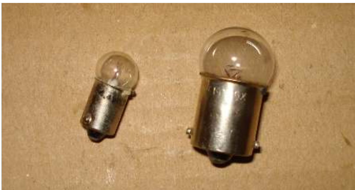
Λαμπτήρες, λαμπάκια – μαγιονέτ