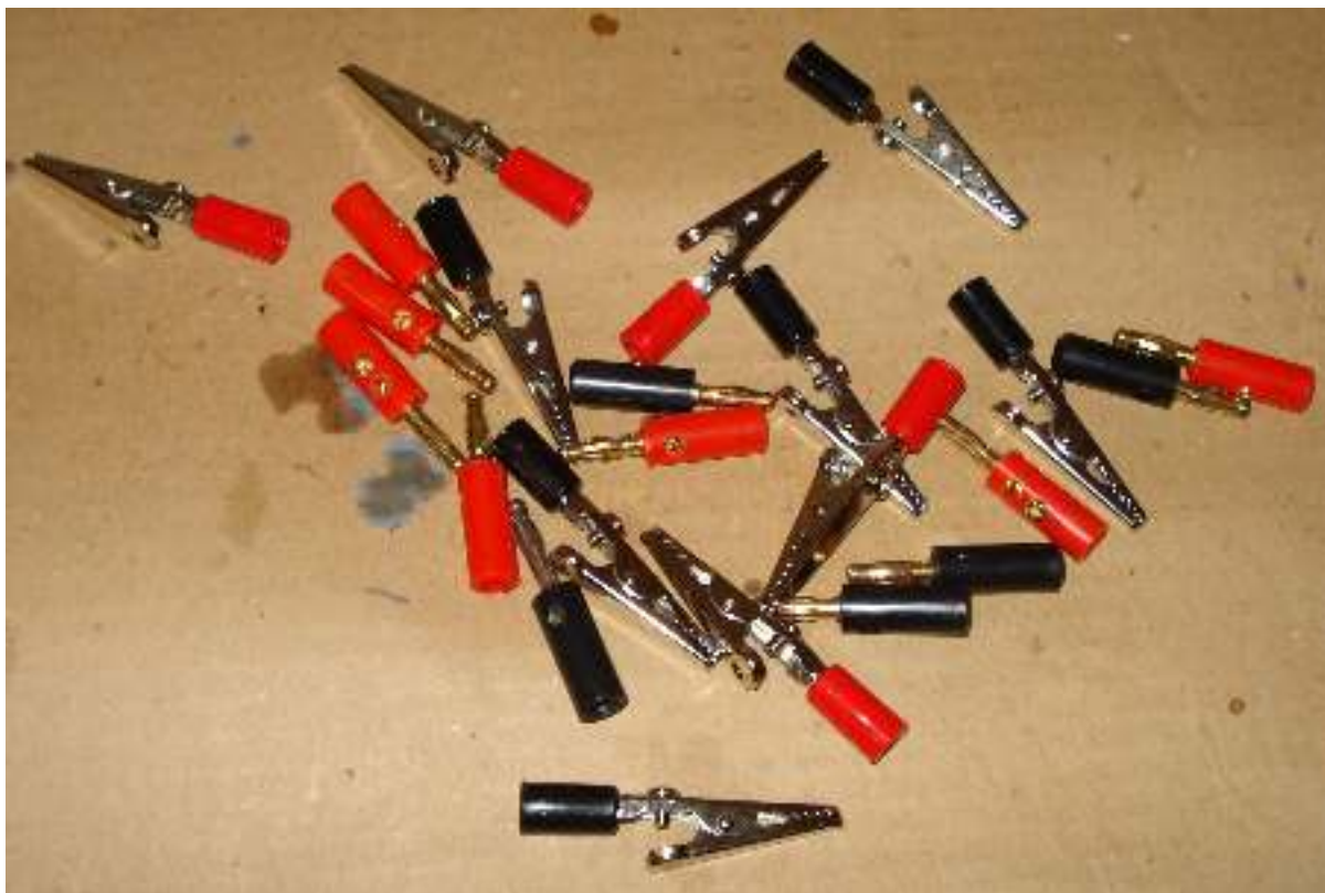
Κροκοδειλάκια – Ρευματολήπτες (μπανάνες)

➤ Υλικά που χρησιμοποιούνται για γρήγορες και εύκολες συνδέσεις