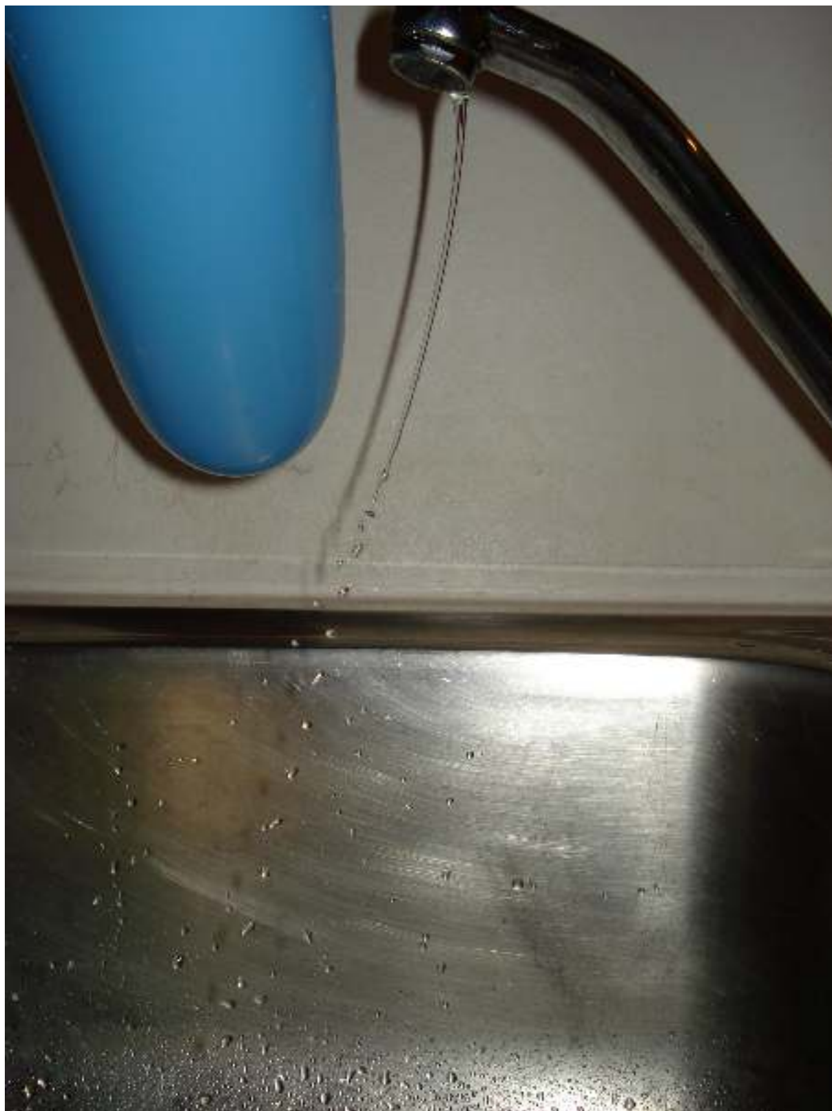
Με καλαμάκι και με ...μπαλόνι