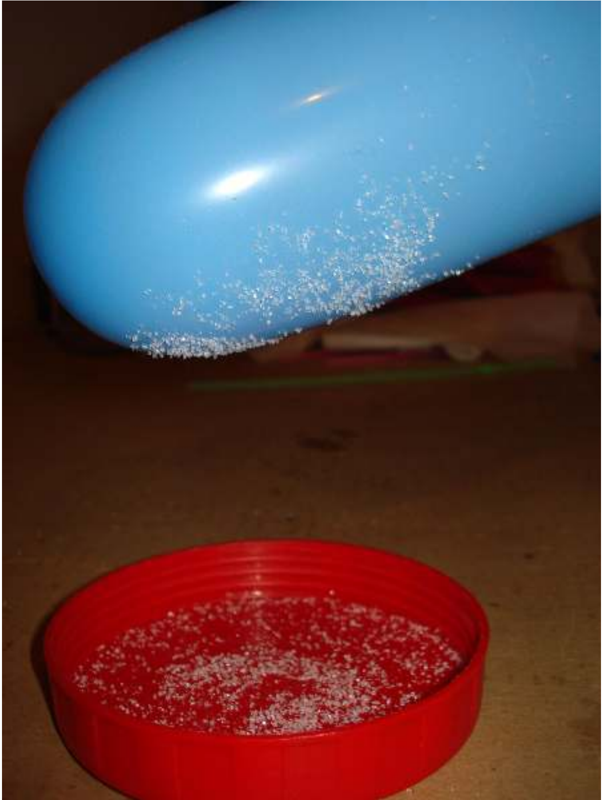
Μπαλόνι ζαχαρωτό ή αλμυρό