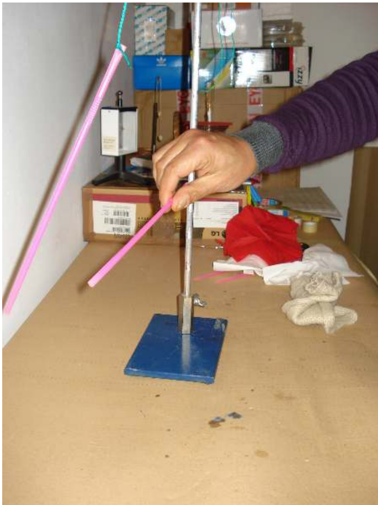
Συγγραφή: Στυλιαννάκης Γιάννης – Δάσκαλος / Συνεργάτης του ΕΚΦΕ Χανίων για την Π.Ε. Φωτογράφιση – Ηλεκτρονική επεξεργασία: Γιαννενάκης Κων/νος - Δάσκαλος