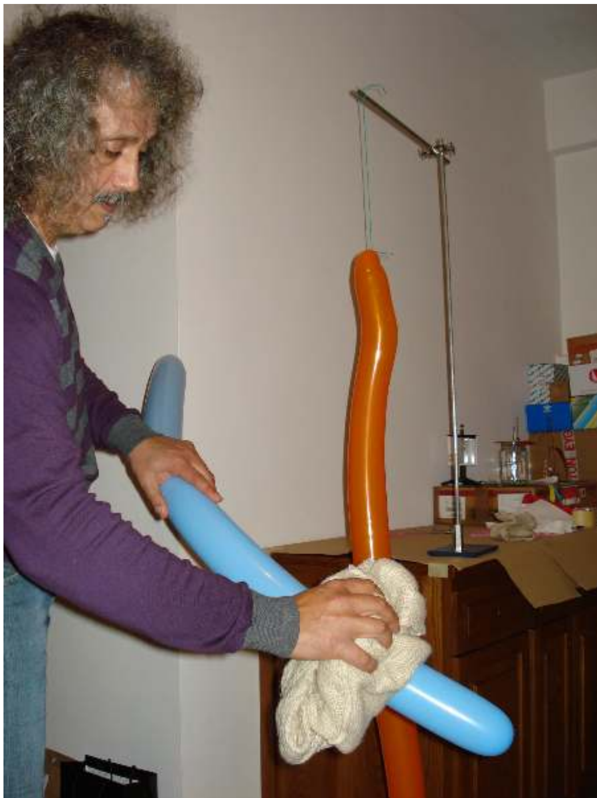
Συγγραφή: Στυλιανακάκης Γιάννης – Δάσκαλος / Συνεργάτης του ΕΚΦΕ Χανίων για την Π.Ε. Φωτογράφιση – Ηλεκτρονική επεξεργασία: Γιαννενάκης Κων/νος - Δάσκαλος