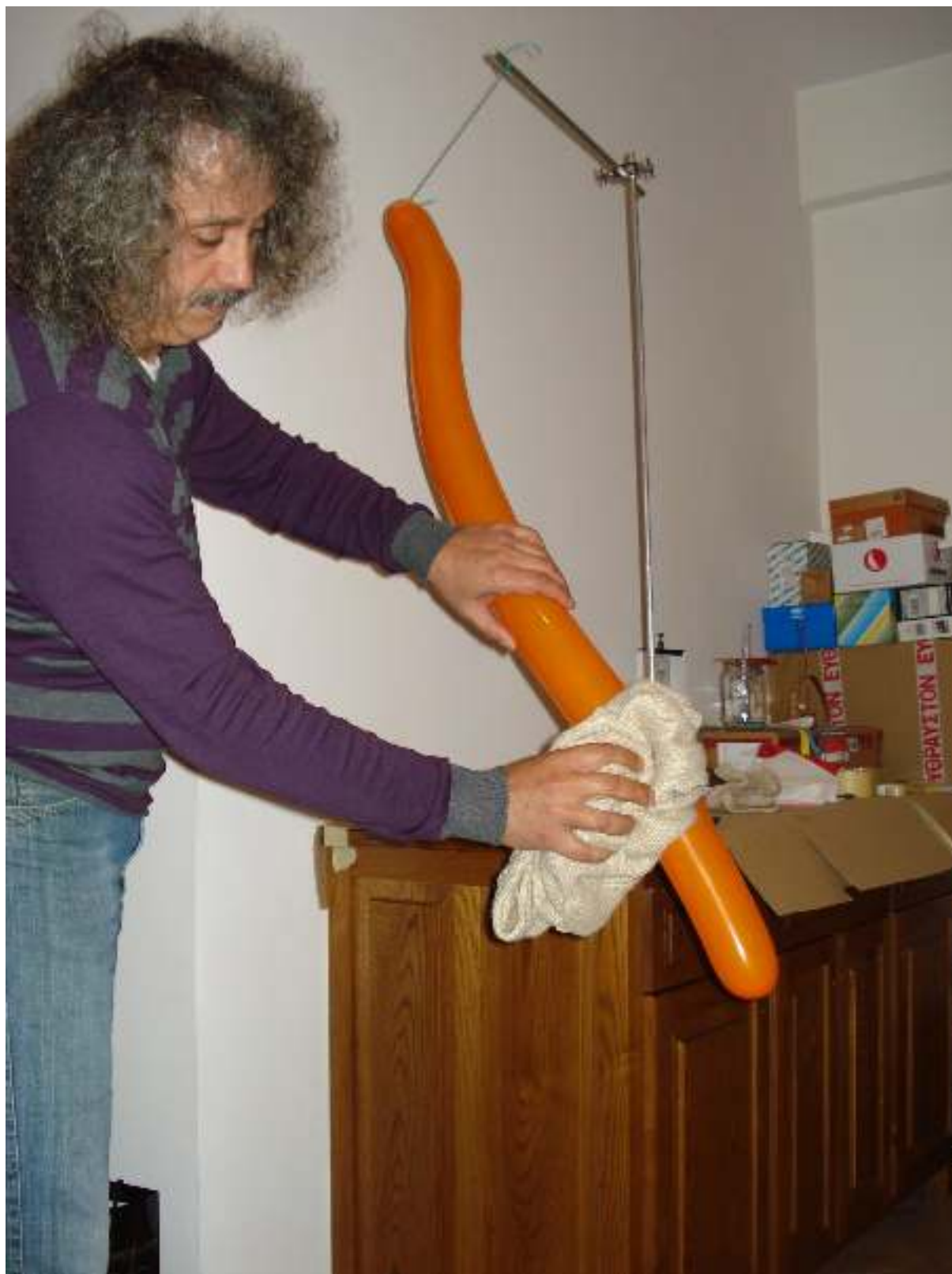
Συγγραφή: Στυλιανακάκης Γιάννης – Δάσκαλος / Συνεργάτης του ΕΚΦΕ Χανίων για την Π.Ε. Φωτογράφιση – Ηλεκτρονική επεξεργασία: Γιαννενάκης Κων/νος - Δάσκαλος