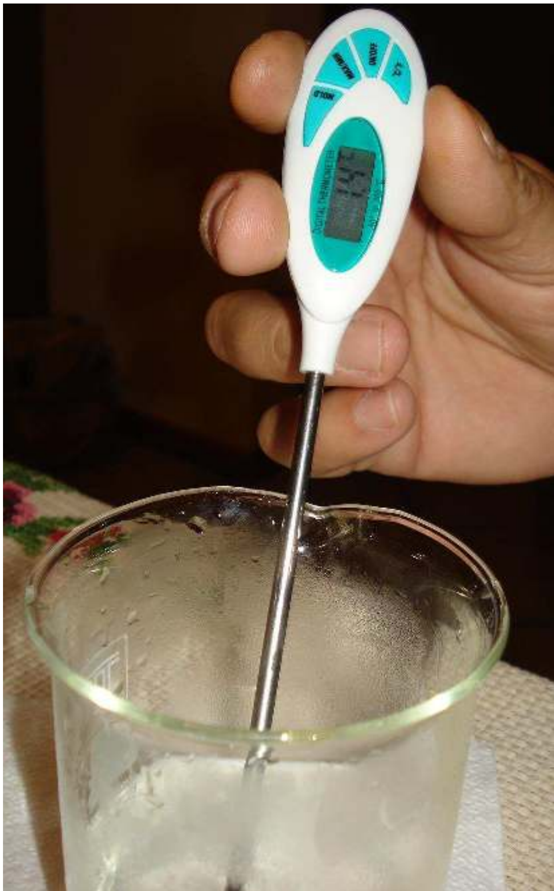
Συγγραφή: Στυλιανακάκης Γιάννης – Δάσκαλος / Συνεργάτης του ΕΚΦΕ Χανίων για την Π.Ε.