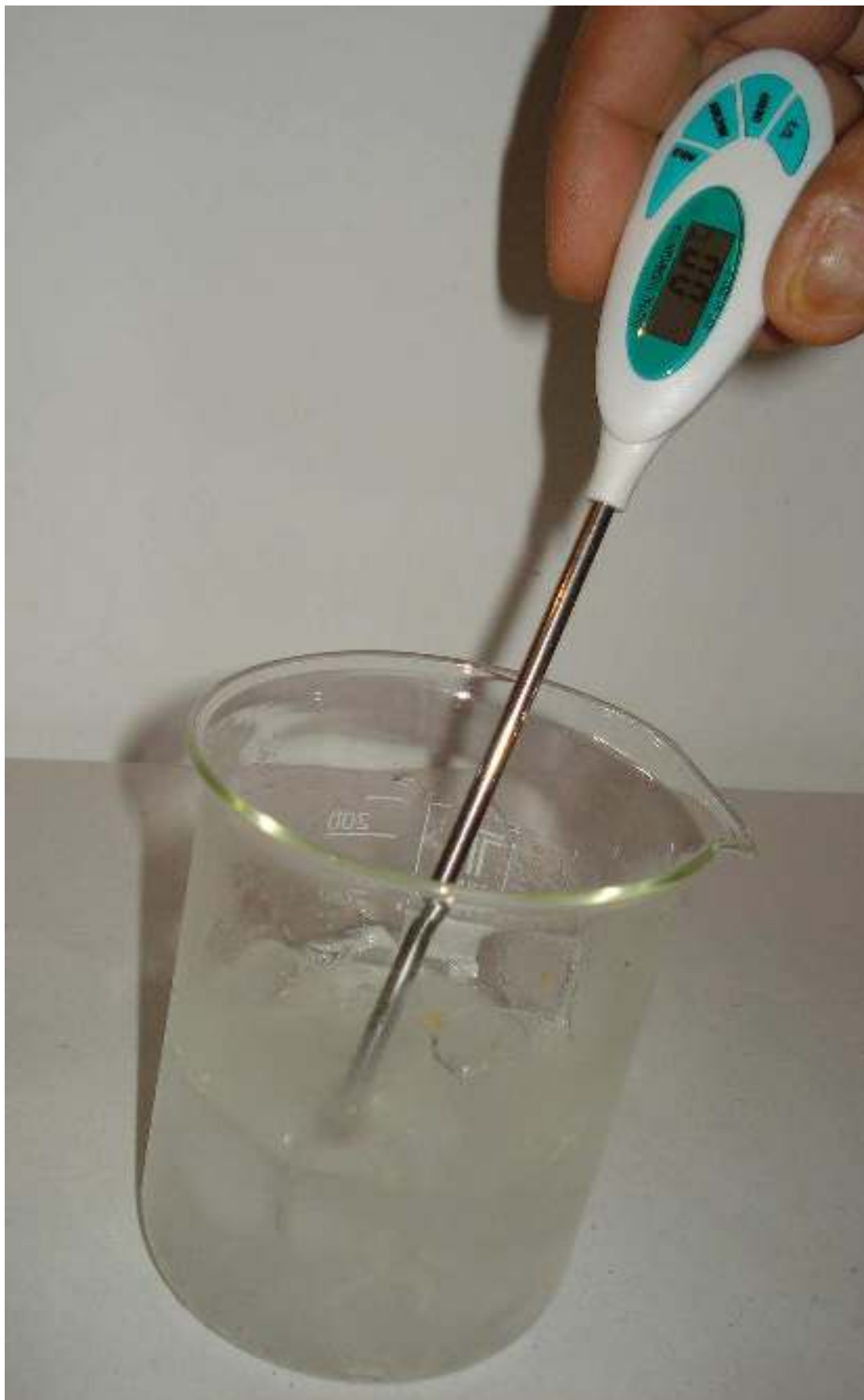
Συγγραφή: Στυλιανακάκης Γιάννης – Δάσκαλος / Συνεργάτης του ΕΚΦΕ Χανίων για την Π.Ε. Φωτογράφιση – Ηλεκτρονική επεξεργασία: Γιαννενάκης Κων/νος - Δάσκαλος