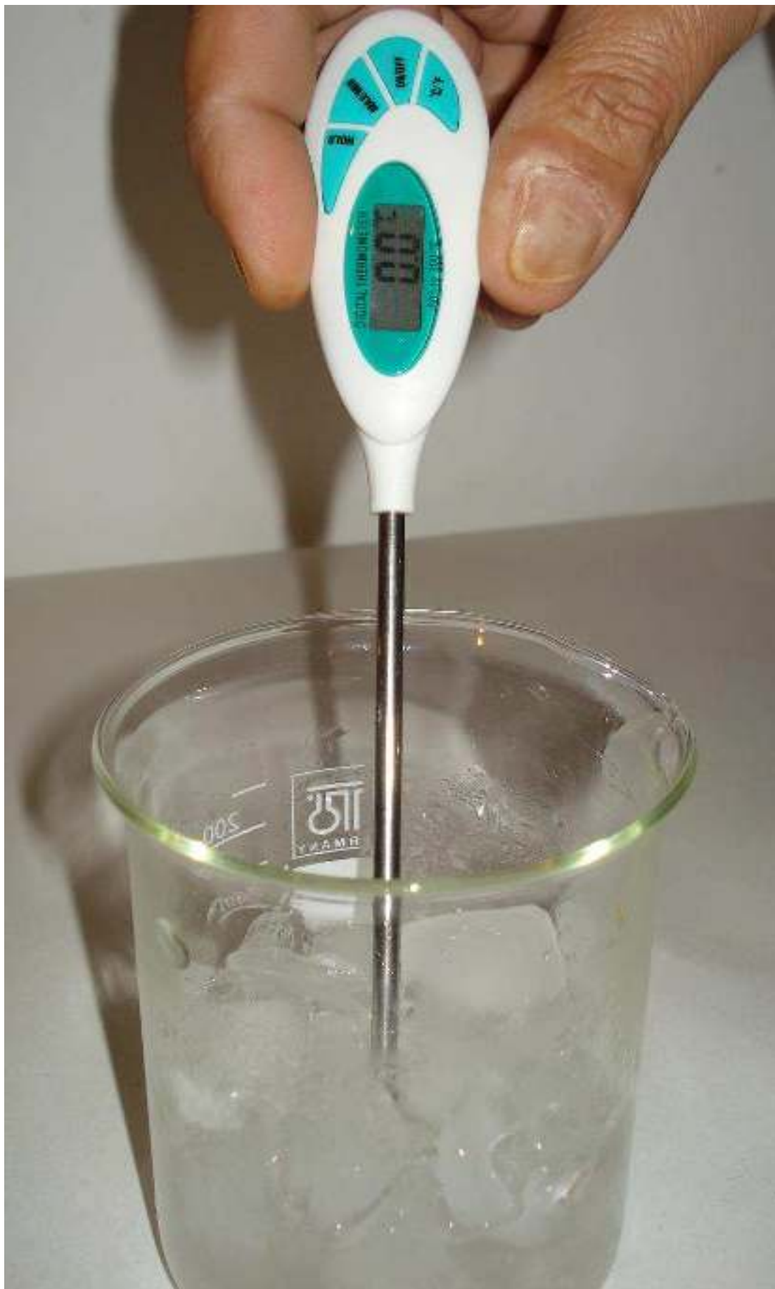
Συγγραφή: Στυλιανακάκης Γιάννης – Δάσκαλος / Συνεργάτης του ΕΚΦΕ Χανίων για την Π.Ε.