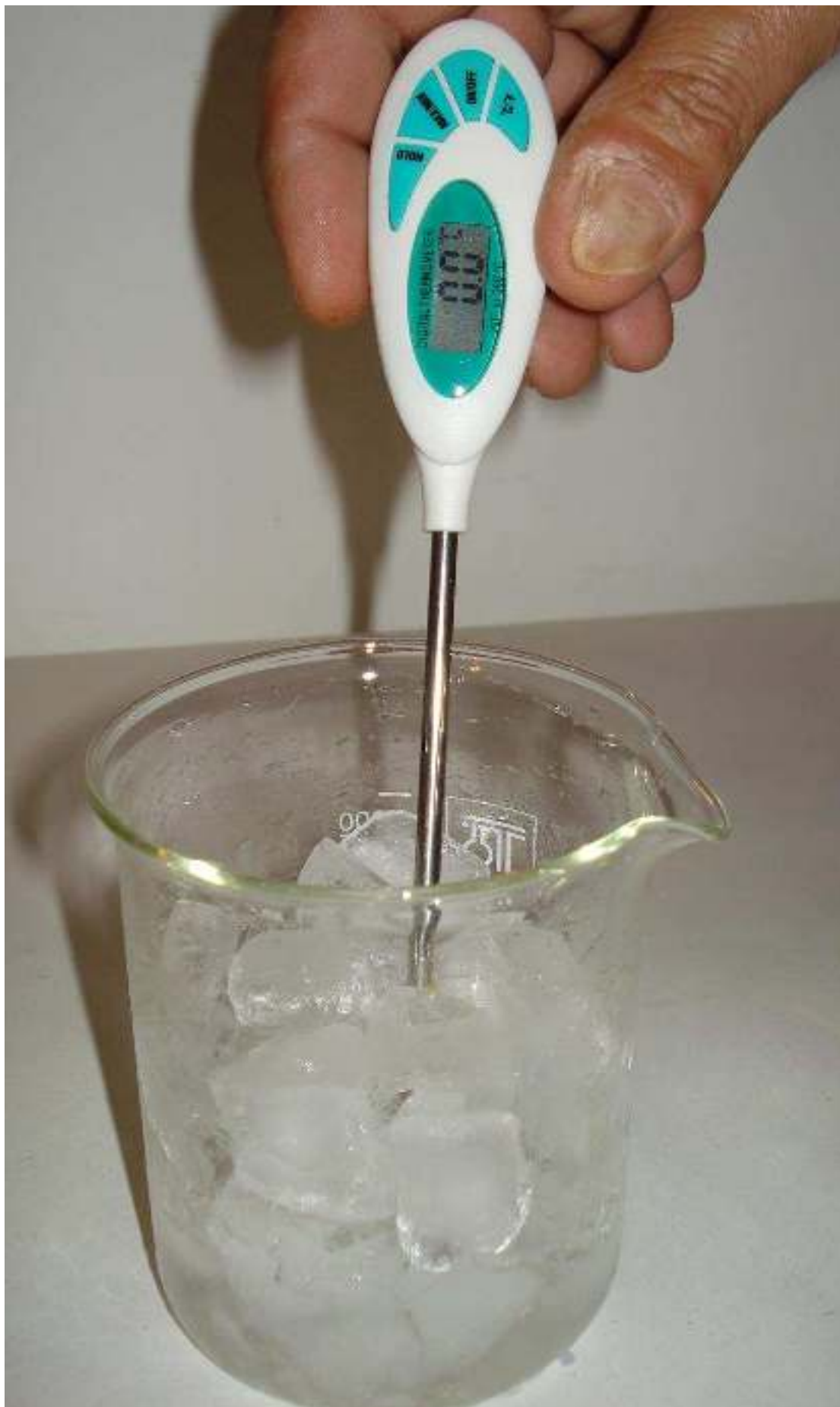
Συγγραφή: Στυλιανακάκης Γιάννης – Δάσκαλος / Συνεργάτης του ΕΚΦΕ Χανίων για την Π.Ε. Φωτογράφιση – Ηλεκτρονική επεξεργασία: Γιαννενάκης Κων/νος - Δάσκαλος