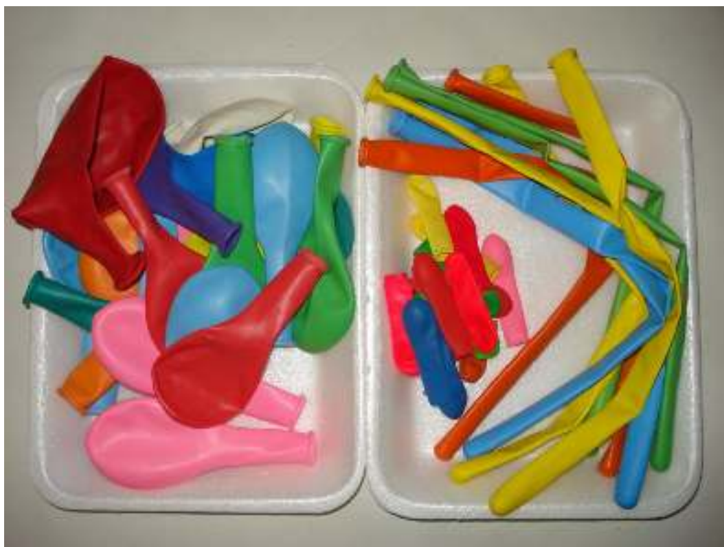
Μπαλόνια σφαιρικά διαφόρων μεγεθών