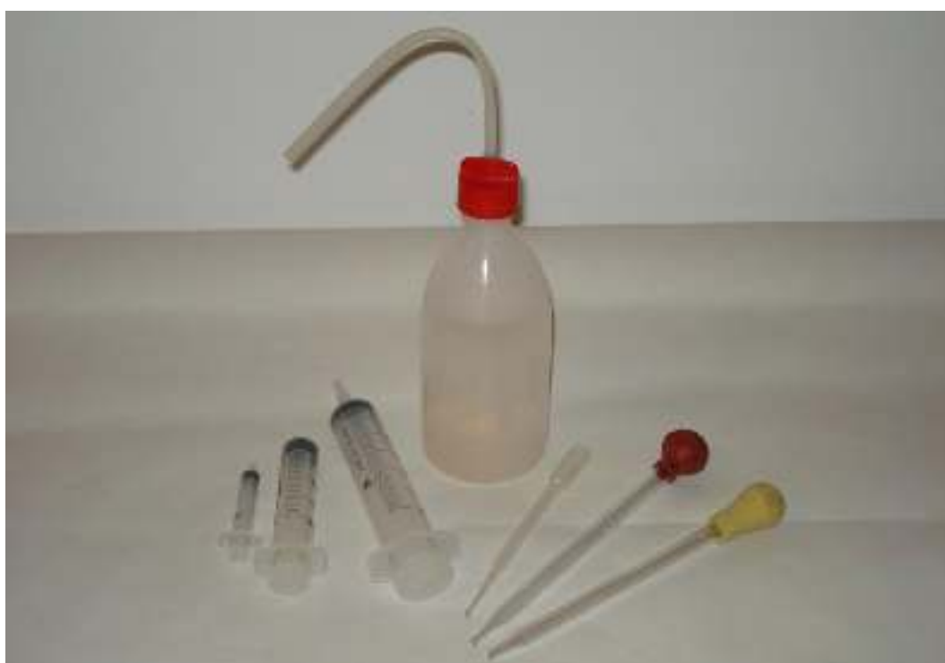
Υδροβολέας Σύριγγες πλαστικές χωρητικότητας 10-60 ml Σταγονόμετρα