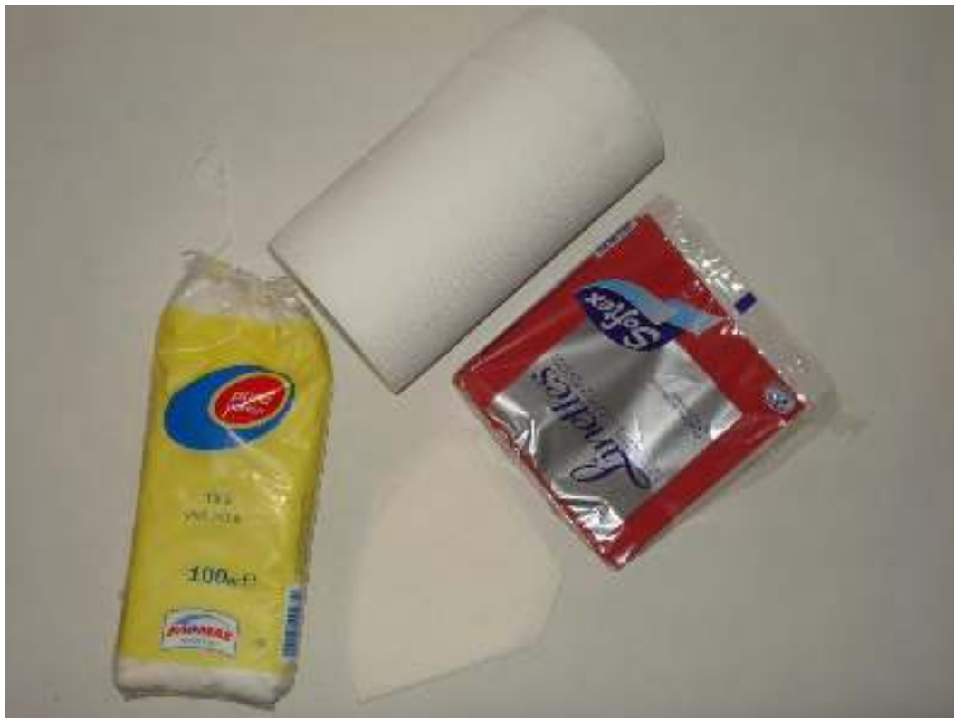
Χαρτί κουζίνας – Χαρτοπετσέτες – Βαμβάκι – Φίλτρα καφέ