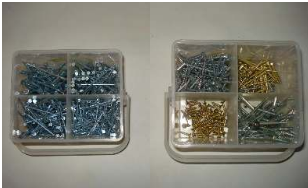
Πρόκες σε διάφορα μεγέθη Βίδες σε διάφορα μεγέθη