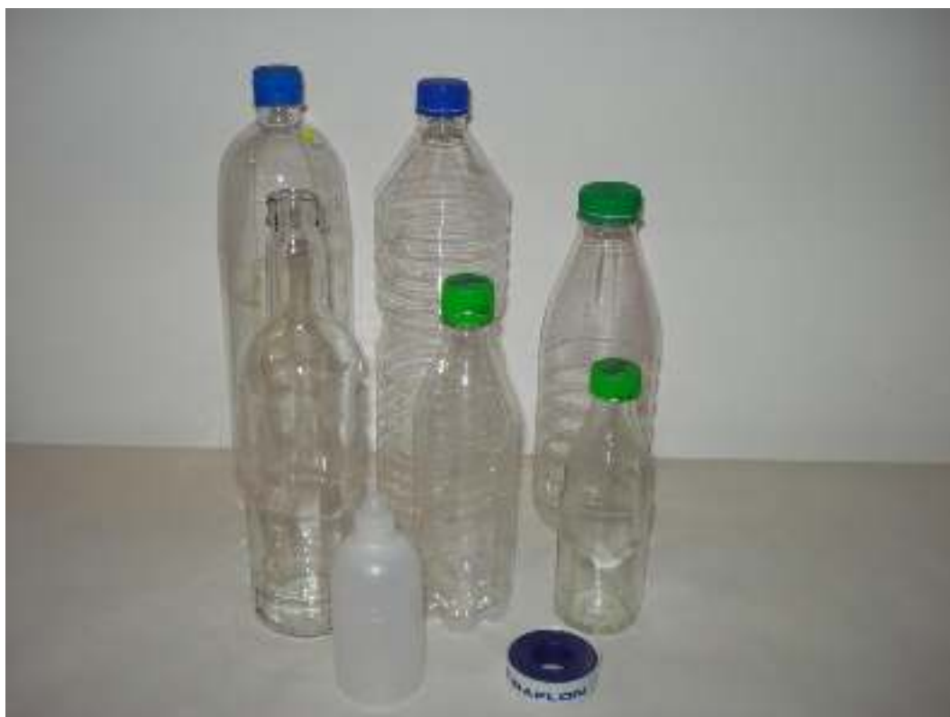
Μπουκάλια γυάλινα και πλαστικά Ταινία τεφλόν

Συγγραφή: Στυλιανακάκης Γιάννης – Δάσκαλος / Συνεργάτης του ΕΚΦΕ Χανίων για την Π.Ε. Φωτογράφιση – Ηλεκτρονική επεξεργασία: Γιαννενάκης Κων/νος - Δάσκαλος