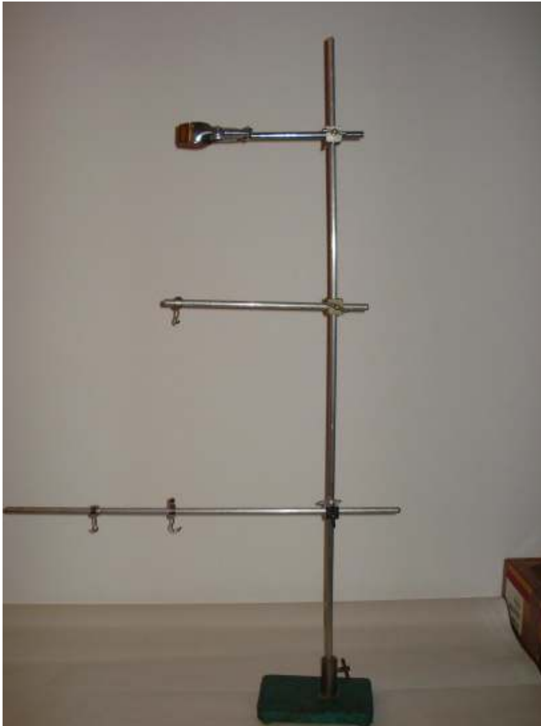
Ορθοστάτης με βάση Ράβδοι αλουμινίου Άγκιστρα Λαβίδα