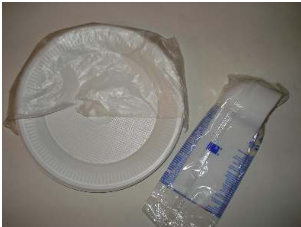
Πλαστικά πιάτα Πλαστικά κουτάλια