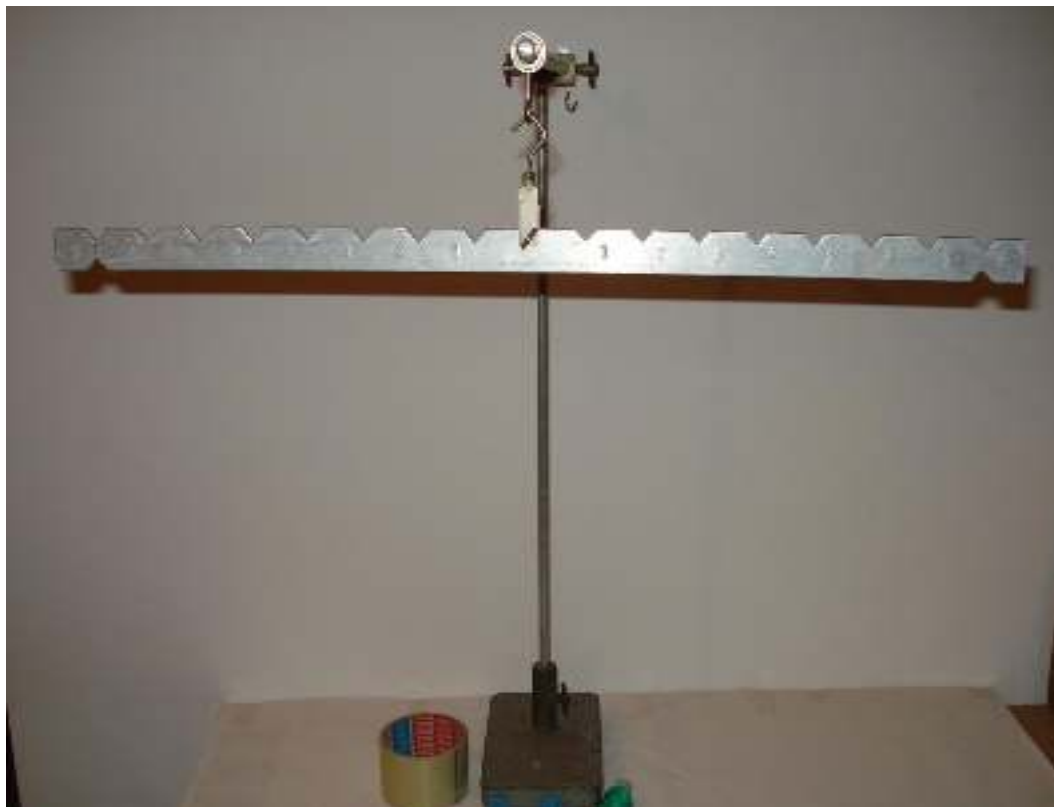
Ορθοστάτης με ράβδο ισορροπίας Σελοτέιπ φαρδύ