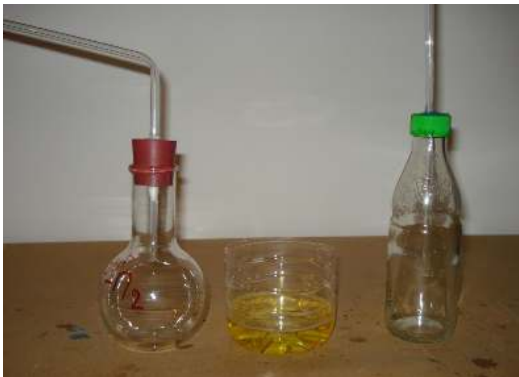
Σφαιρική φιάλη με ελαστικό πώμα ή γυάλινο μπουκάλι από αναψυκτικό Γυάλινο σωληνάκι ίσιο ή λυγισμένο Ποτήρι με απορρυπαντικό πιάτων