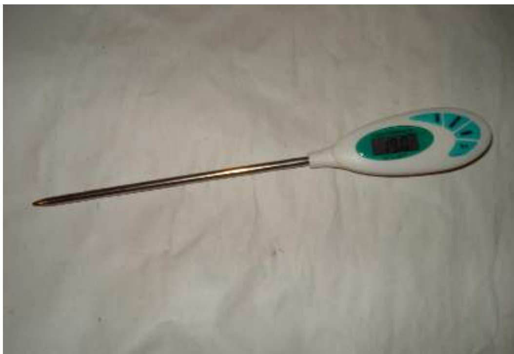
Ηλεκτρονικό θερμόμετρο εργαστηρίου

Συγγραφή: Στυλιανακάκης Γιάννης – Δάσκαλος / Συνεργάτης του ΕΚΦΕ Χανίων για την Π.Ε. Φωτογράφιση – Ηλεκτρονική επεξεργασία: Γιαννενάκης Κων/νος - Δάσκαλος