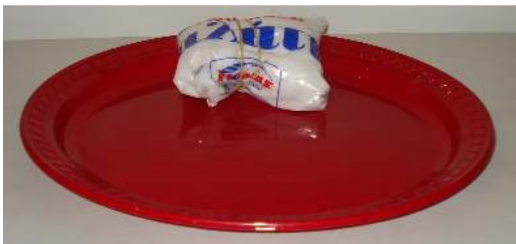
Πλαστικά πιάτα μεγάλα, κόκκινα Αλάτι