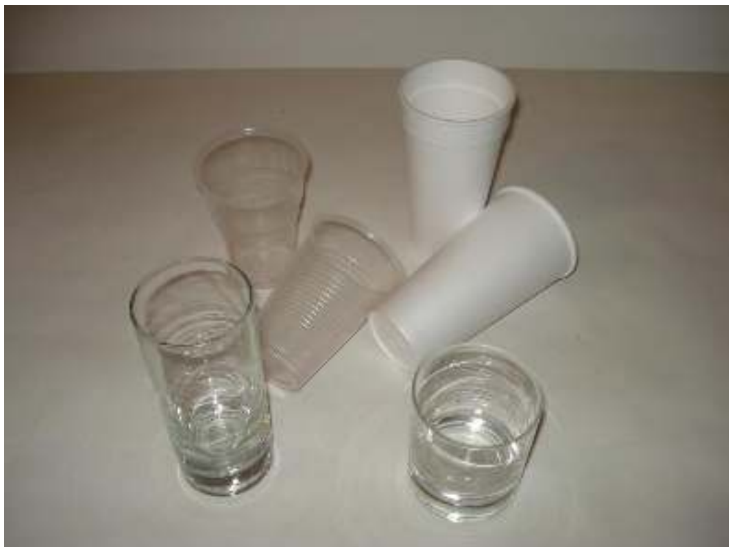
Ποτήρια γυάλινα μικρά και μεγάλα Ποτήρια πλαστικά διαφανή Ποτήρια από φελιζόλ