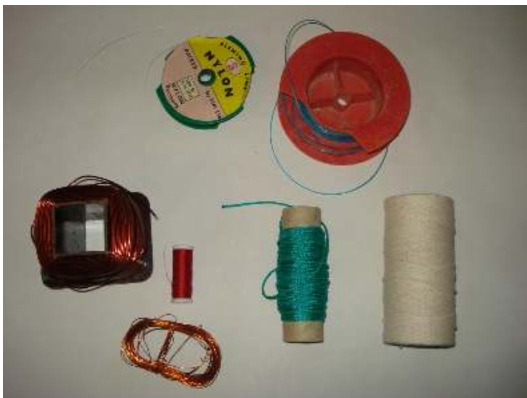
Σύρμα χαλκού χοντρό, λεπτό Νήμα ελαστικό (πετονιά) Νήμα πλαστικό Σπάγκος

Συγγραφή: Στυλιανακάκης Γιάννης – Δάσκαλος / Συνεργάτης του ΕΚΦΕ Χανίων για την Π.Ε. Φωτογράφιση – Ηλεκτρονική επεξεργασία: Γιαννενάκης Κων/νος - Δάσκαλος