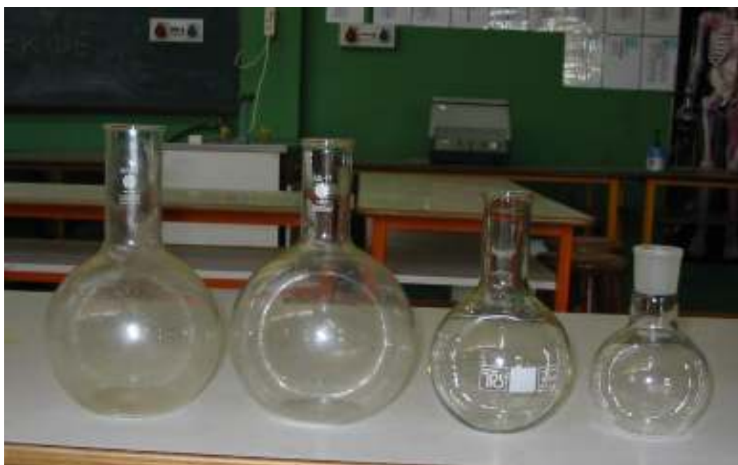
Σφαιρικές φιάλες ζέσης