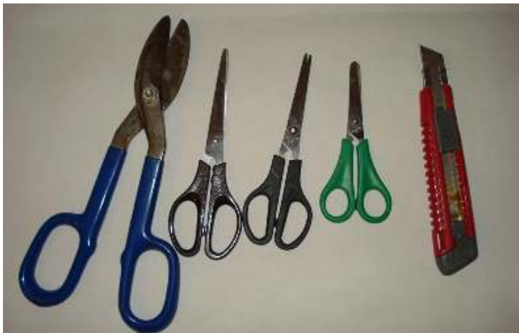
Ψαλίδι για κοπή λεπτής λαμαρίνας Ψαλίδι απλό Κοπίδι