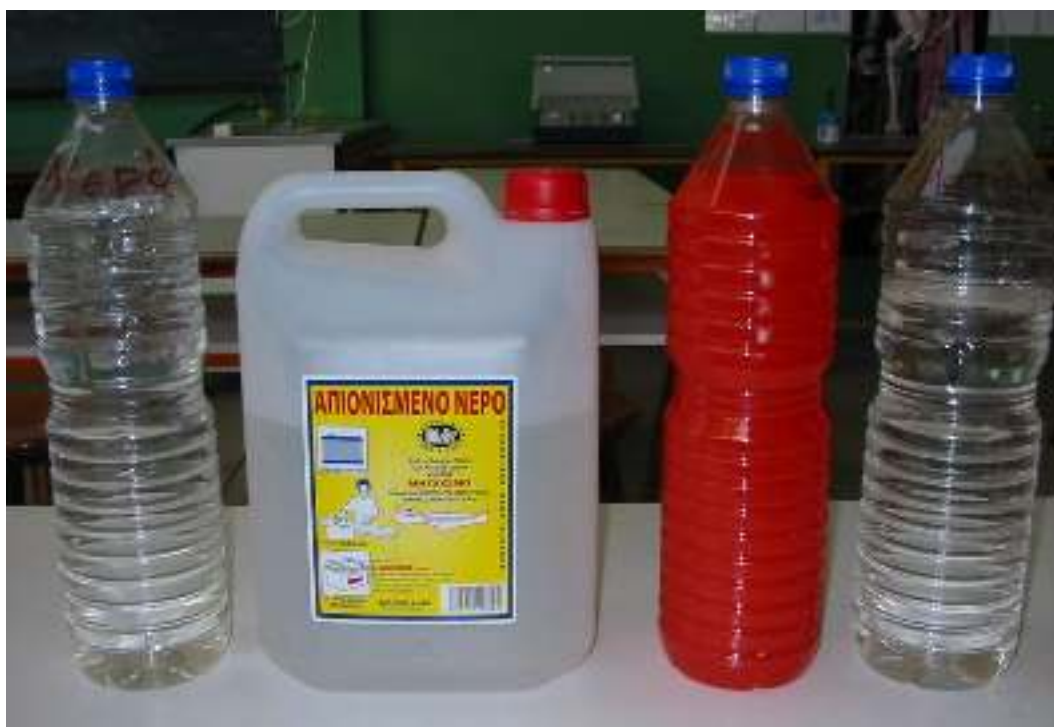
Νερό βρύσης – Νερό αποσταγμένο Νερό με χρώμα – Αλατόνερο