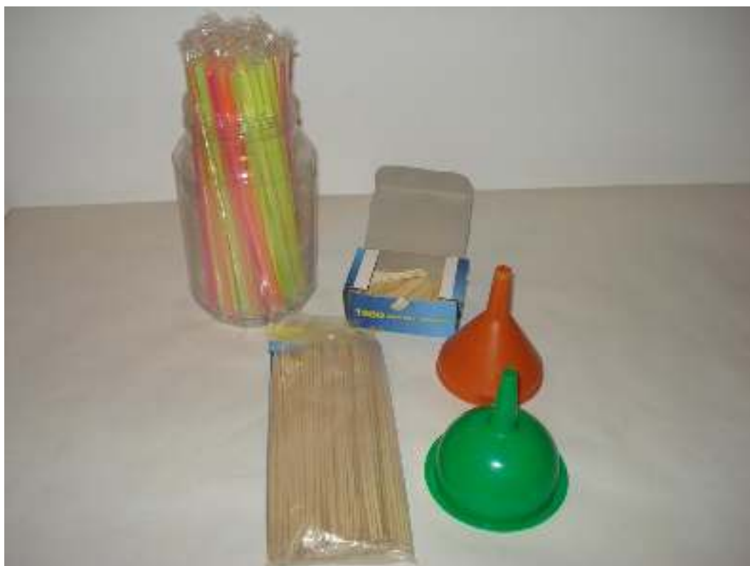
Οδοντογλυφίδες – Καλαμάκια ξύλινα και πλαστικά Χωνιά πλαστικά