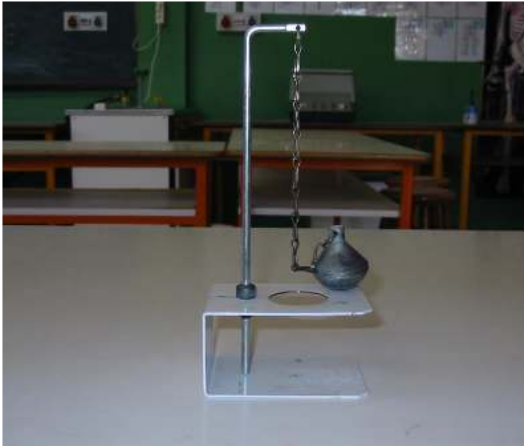
Συσκευή διαστολής κατά όγκο (κυβική) με μεταλλική σφαίρα