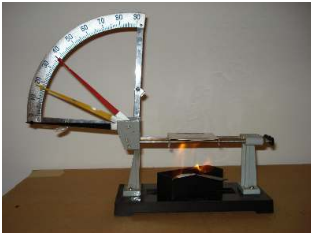
Συσκευή γραμμικής διαστολής, τριπλή