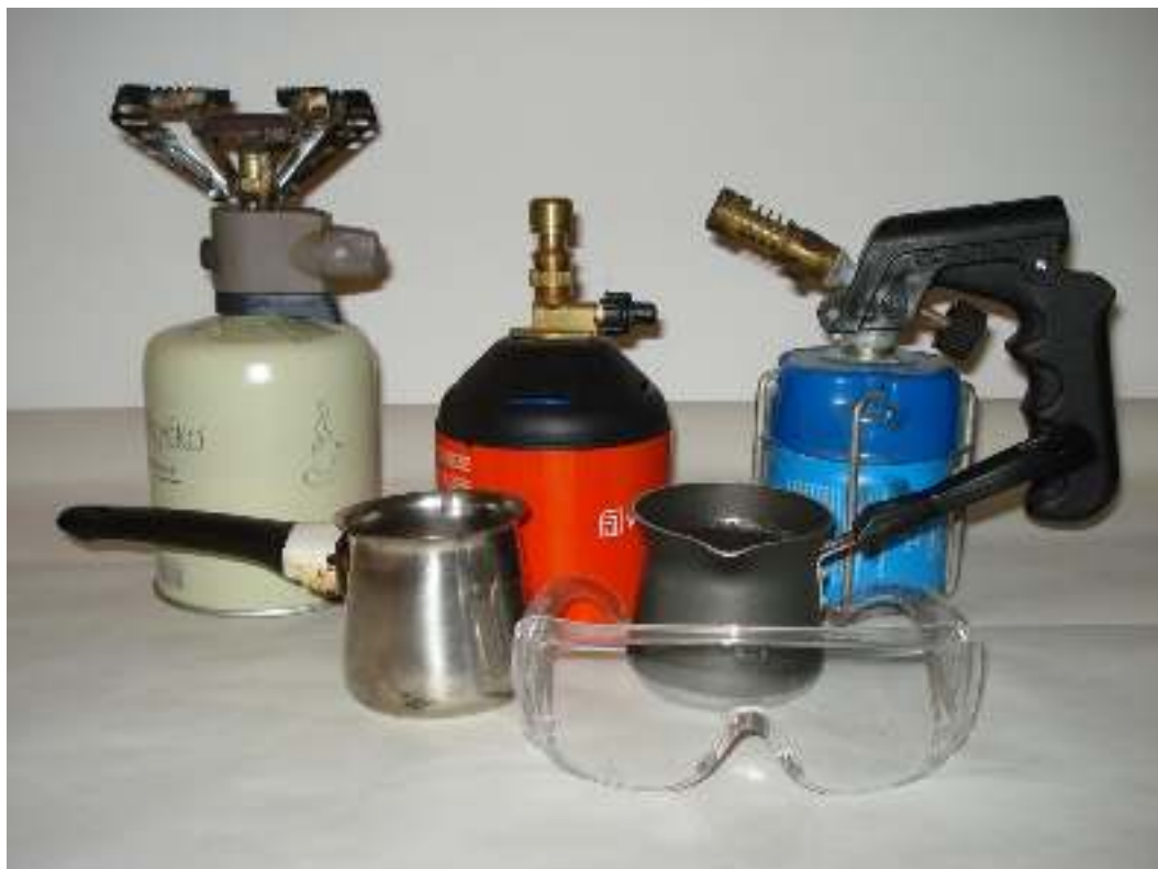
Καμινέτο ασφάλειας - Καμινέτο μονής φλόγας - Καμινέτο φλόγιτρο - Μπρίκια Γυαλιά προστασίας