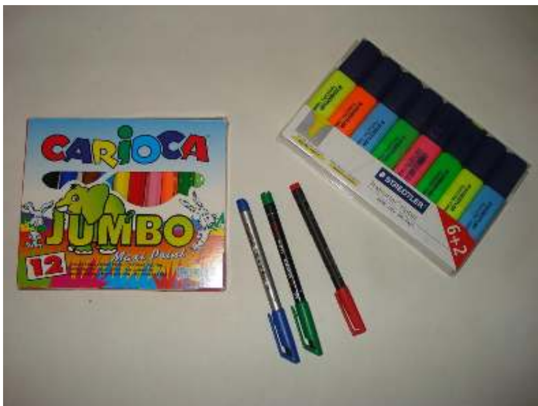
Μαρκαδόροι ανεξίτηλοι Μαρκαδόροι απλοί Μαρκαδόροι υπογράμμισης