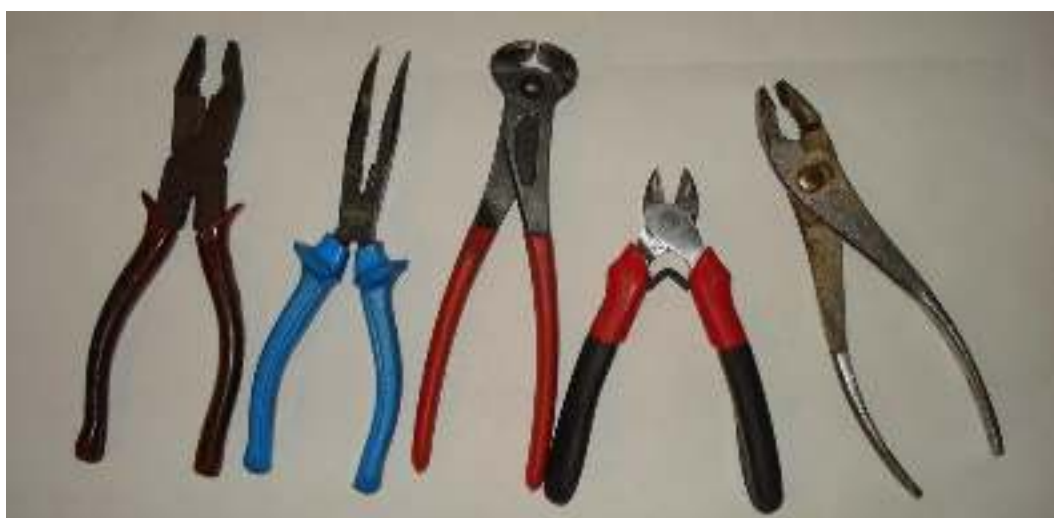
Πένσα – Τσιμπίδα Κοφτάκι – Τανάλια