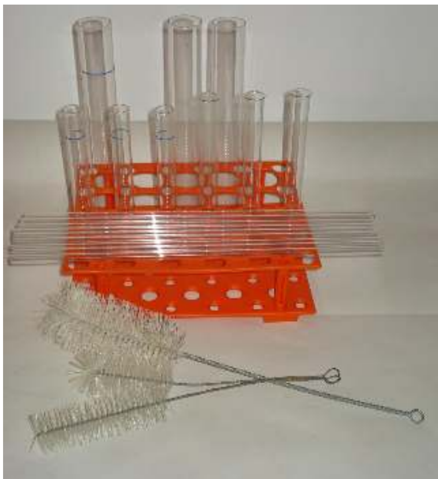
Γυάλινα σωληνάκια Γυάλινοι δοκιμαστικοί σωλήνες απλοί Γυάλινοι δοκιμαστικοί σωλήνες πυρέξ Βουρτσάκια για πλύσιμο σωλήνων Βάση για στέγνωμα και τοποθέτηση σωλήνων