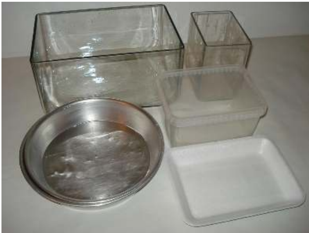
Λεκάνες γυάλινες Ταψάκια αλουμινίου