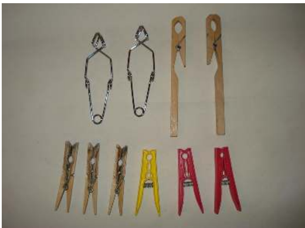
Λαβίδες μεταλλικές απλές Λαβίδες ξύλινες Μανταλάκια ξύλινα Μανταλάκια πλαστικά