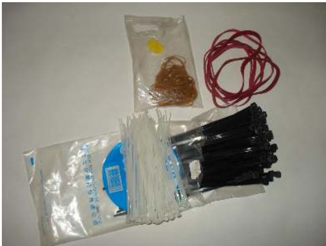
Λαστιγάκια μικρά, μεγάλα και φαρδιά – Δεματικό