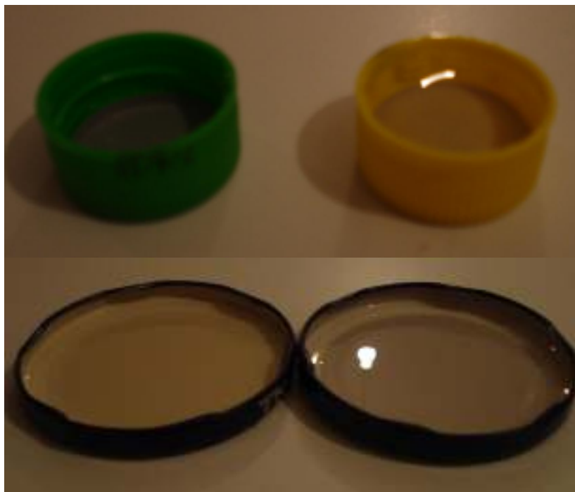
Καπάκια πλαστικά ή μεταλλικά