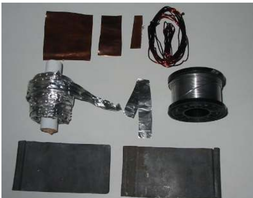
Φύλλα ή σύρμα χαλκού – Φύλλα ή σύρμα αλουμινίου Καλάι – Φύλλα μολύβδου

Συγγραφή: Στυλιανακάκης Γιάννης – Δάσκαλος / Συνεργάτης του ΕΚΦΕ Χανίων για την Π.Ε. Φωτογράφιση – Ηλεκτρονική επεξεργασία: Γιαννενάκης Κων/νος - Δάσκαλος