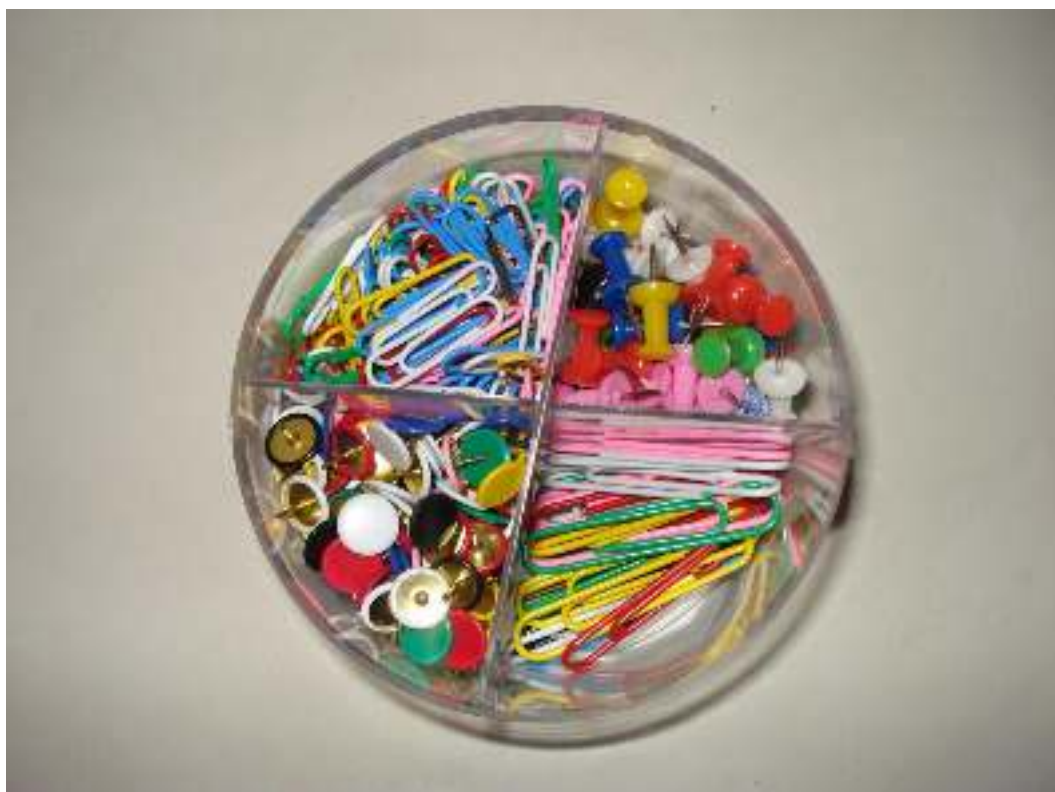
Καρφίτσες με πλαστικό κεφαλάκι Πινέζες Συνδετήρες