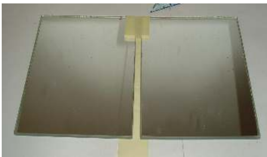
Γυάλινο ή μεταλλικό καπάκι κατσαρόλας Τζάμι ή καθρέφτες

Συγγραφή: Στυλιανακάκης Γιάννης – Δάσκαλος / Συνεργάτης του ΕΚΦΕ Χανίων για την Π.Ε.