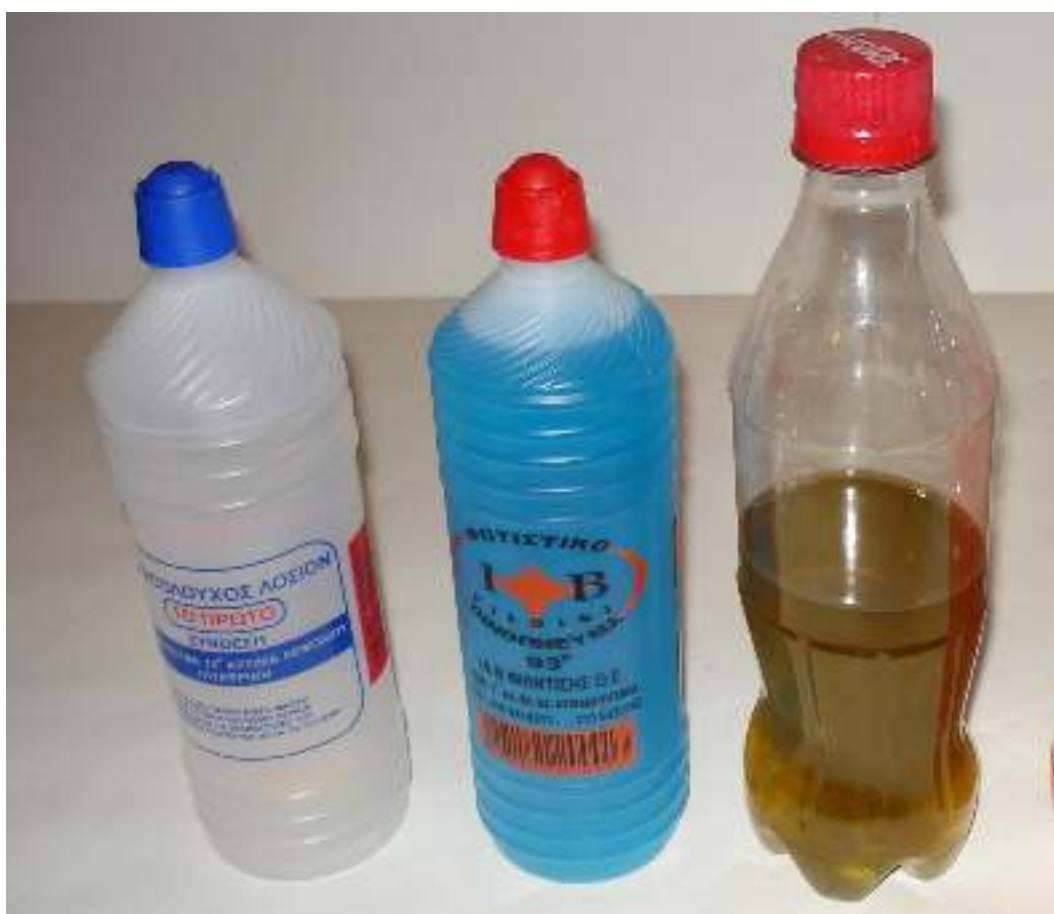
Οινόπνευμα άχρωμο ή μπλε Λάδι – Βενζίνη για καθάρισμα ρούχων

Συγγραφή: Στυλιανακάκης Γιάννης – Δάσκαλος / Συνεργάτης του ΕΚΦΕ Χανίων για την Π.Ε. Φωτογράφιση – Ηλεκτρονική επεξεργασία: Γιαννενάκης Κων/νος - Δάσκαλος